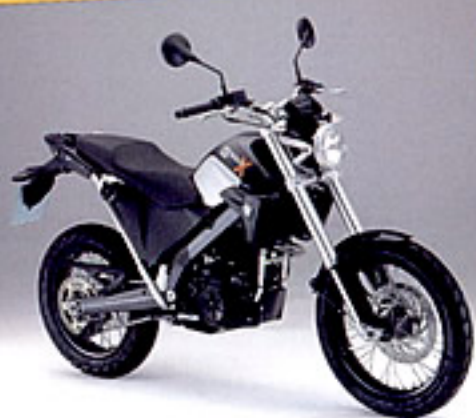
BMW G 650 Xcountry