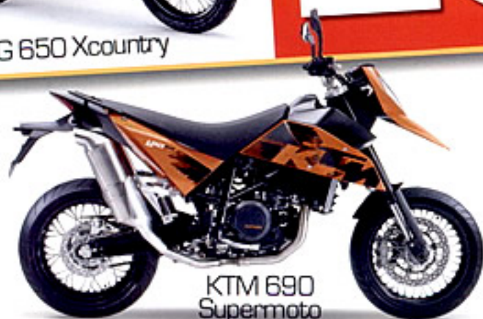
KTM 690 Supermoto